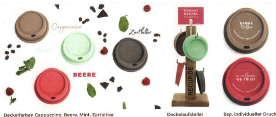
Deckelfarben Cappuccino, Beere, Mint, Zartbitter